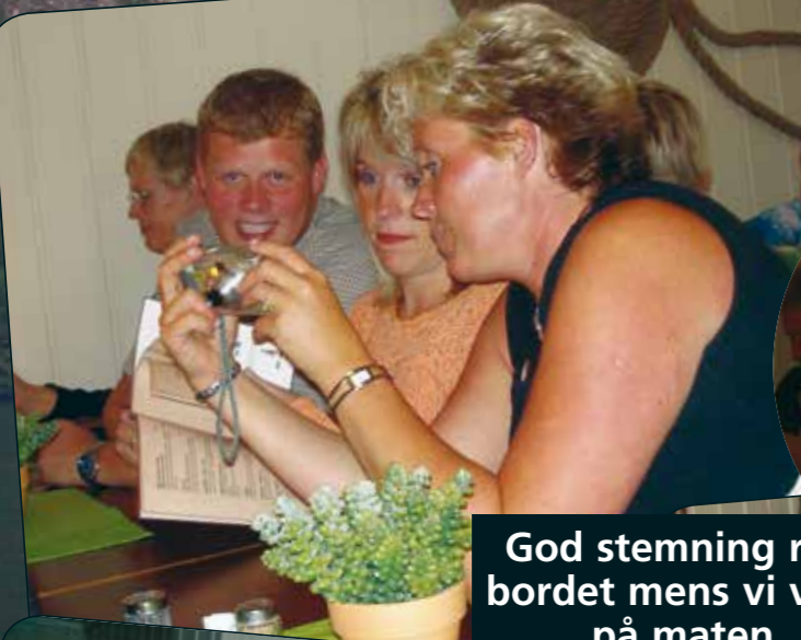
God stemning rundt bordet mens vi venter på maten...