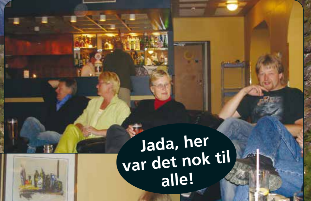
Jada, her var det nok til alle!