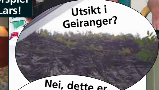
Utsikt i Geiranger?