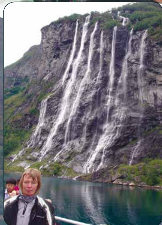
Vi hadde en flott tur ut Geirangerfjorden til Hellesylt.