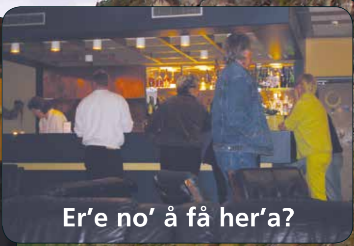
Er'e no' å få her'a?