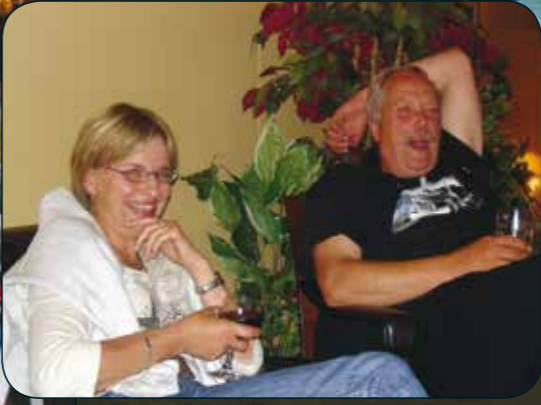
Sjefen sjøl reiv i en halv-liter på hele gjengen! Det var nok i yr glede over å bli bestefar!