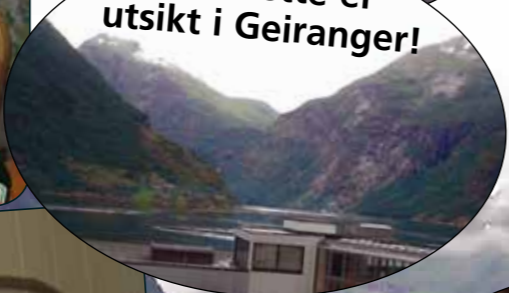
Nei, dette er utsikt i Geiranger!